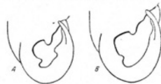
Рис. 2. Контуры устья Jamina tridens

Перенесение активного животного в резко неблагоприятные условия — под яркие лучи солнца или в тень, но при температуре воздуха больше 25° и относительной влажности менее 30%, сопровождается резкой реакцией животного. Сперва в раковину очень быстро втягивается голова, а затем животное начинает интенсивно тереться ногой об