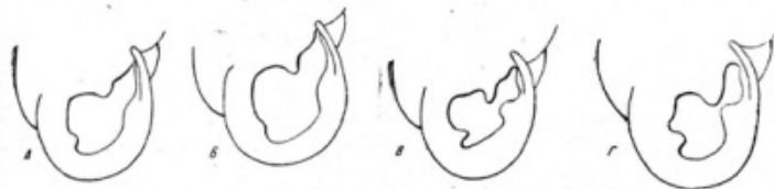
Рис. 3. Контуры устья современных Jamnia tridens из разных мест ареала А — Грузия, index = 1,22; Б — Армения, index = 1,22; В — Изюм, index = 1,84; Г — Крым (Караван-Сарай), index = 1,90

Для более точного суждения о величине зубов у современных и полуископаемых форм было сделано вычисление отношения суммы расстояний между вершинами зубов к сумме расстояний между стенками устья. В результате получился ряд индексов. Рассматривая рисунки устьев (рис. 2), которые сделаны с помощью рисовального аппарата, и значения индексов, легко убедиться в том, что полуископаемые формы и современные формы представляют хорошо разграниченные группы.